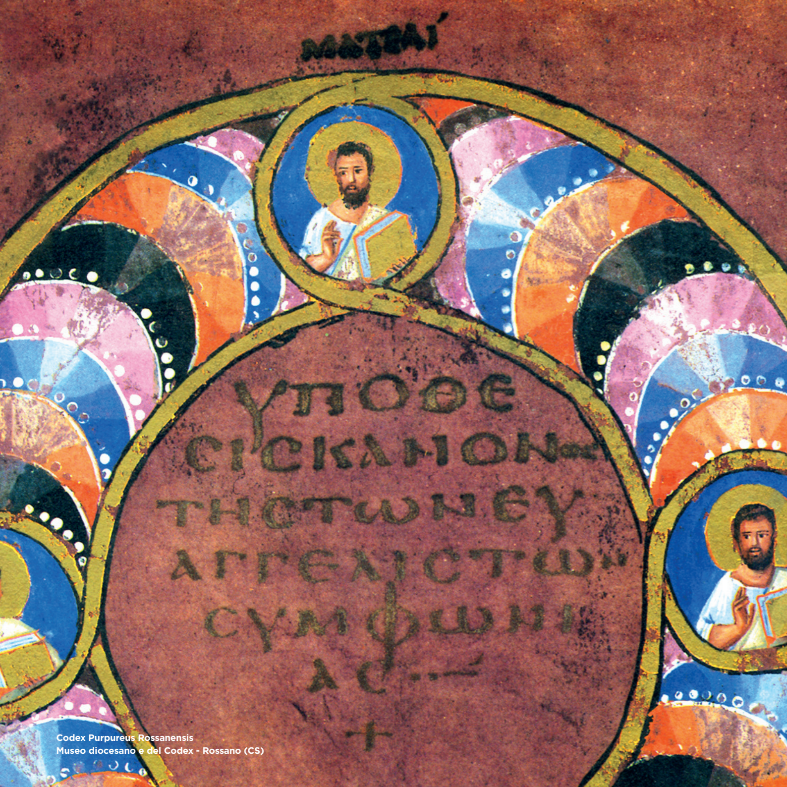
Codex Purpureus Rossanensis Museo diocesano e del Codex - Rossano (CS)