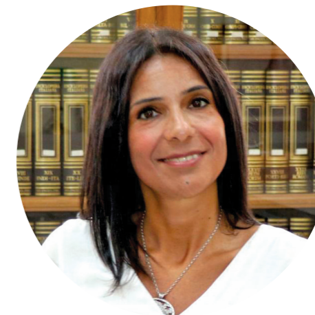
Vicepresidente Giusi Princi

“ ESPLORA L'INCANTO DELLA CALABRIA Viaggio nel cuore della Calabria: un'emozionante sinfonia di poesia, storia e arte. Vi aspettiamo numerosi in uno stand moderno ed accogliente, per diffondere nel mondo la vitalità, le luci e i colori della nostra Calabria. ”