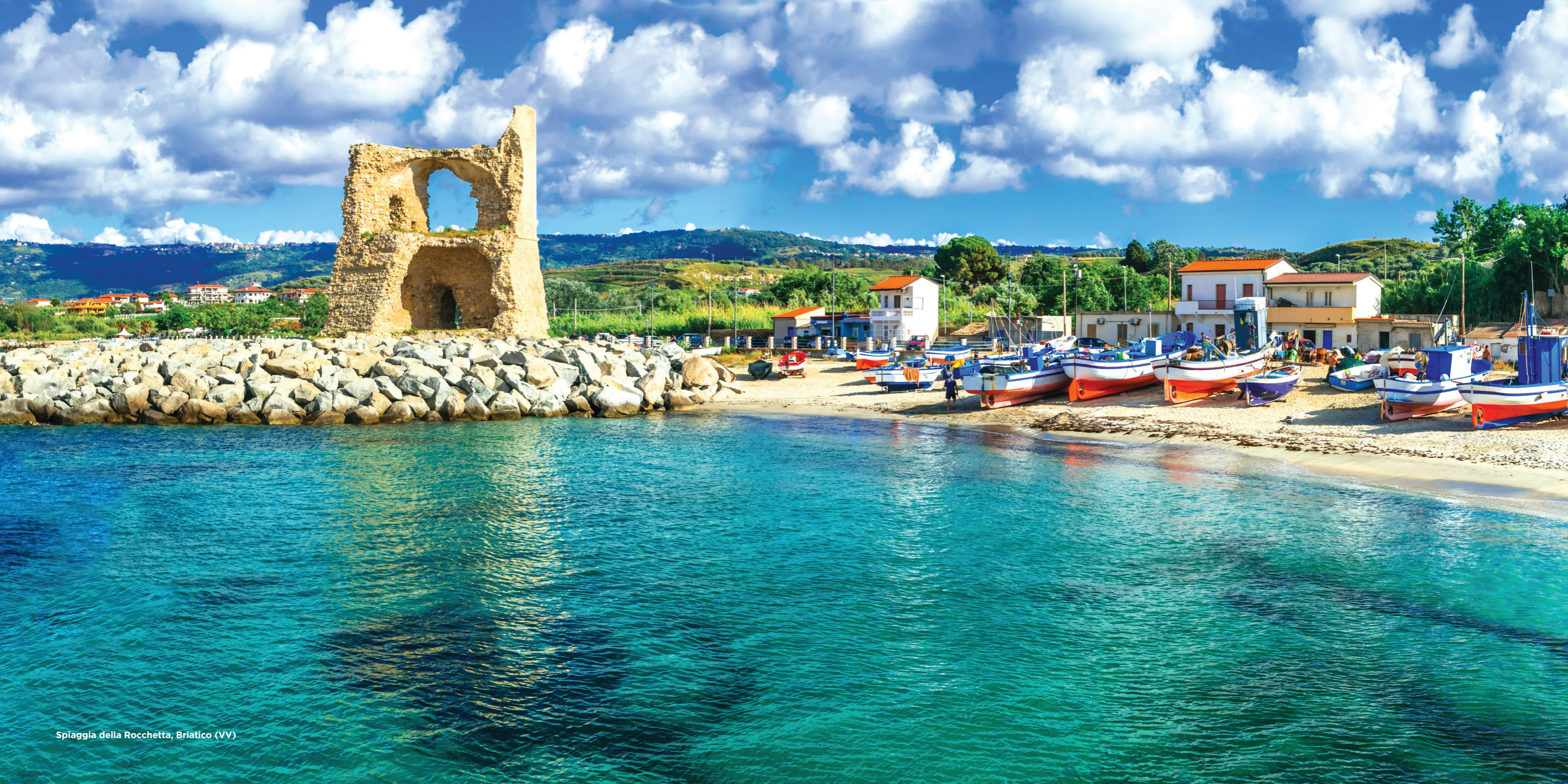
Spiaggia della Rocchetta, Briatico (VV)